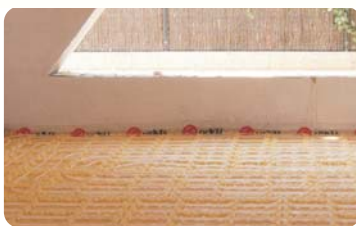
Guardería en Alovera