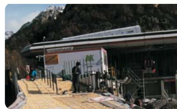
Acceso a cabinas Esquí - Panticosa