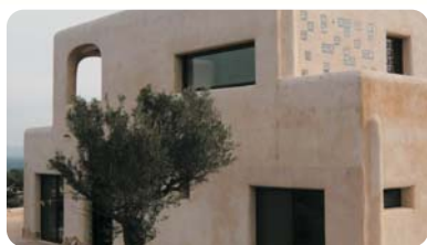
Vivienda Unifamiliar Castellón